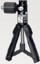
氣壓產生器(-83 到 4000 kPa)